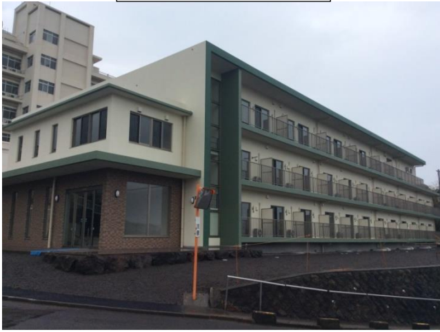
グリーンハイツ外観