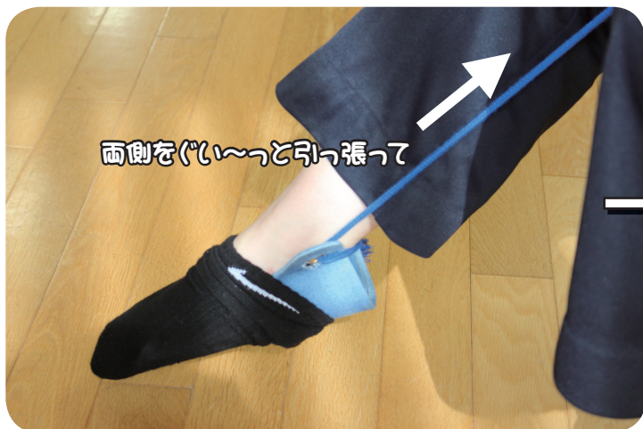
③ソックスエイドのひもを引っ張って靴下をはきます。