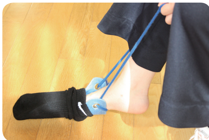
②ソックスエイドにつま先を入れます。