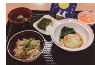
季節によって行事食が楽しめます