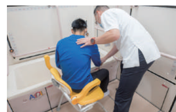
退院後の生活動作を確認しながら