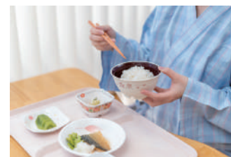
朝食で 1日の訓練の活力に