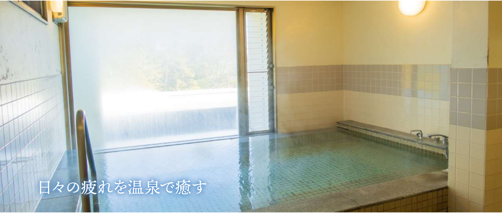
日々の疲れを温泉で癒す