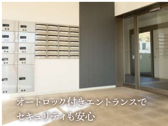
オートロック付きエントランスで セキュリティも安心