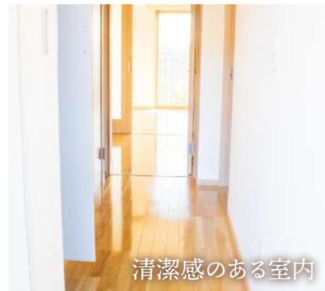
清潔感のある室内