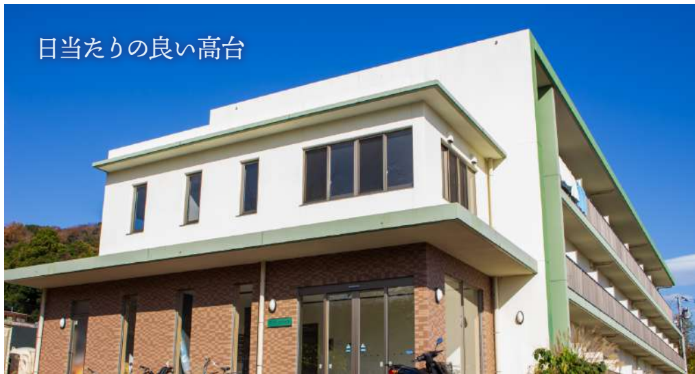
日当たりの良い高台